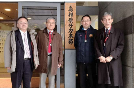
島根原子力発電所視察

2016 4/11-12 (月) 南部町朝綱ダム小水力発電施設・大橋川コミュニティセンター・島根原子力発電所視察