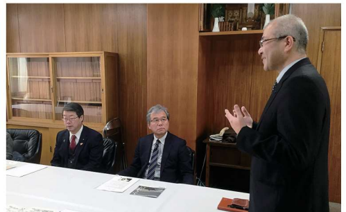
子育て支援の先進地福井県で子育て支援策について説明を受ける