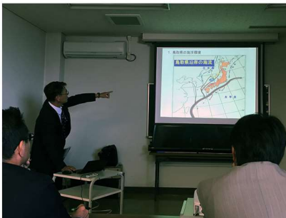
鳥取県漁業の現状について説明を受ける