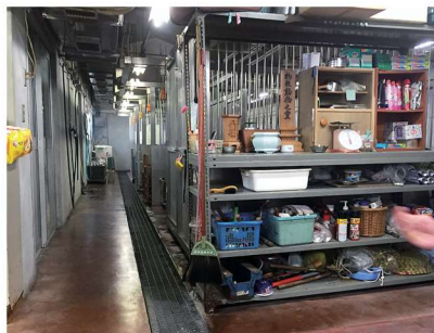
収容された犬・猫が一定期間を過ごす施設