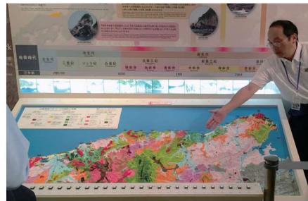
山陰海岸の形成過程を模型を見ながら学ぶ