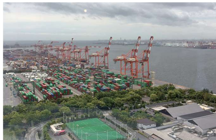
東京みなと館からの臨海副都心