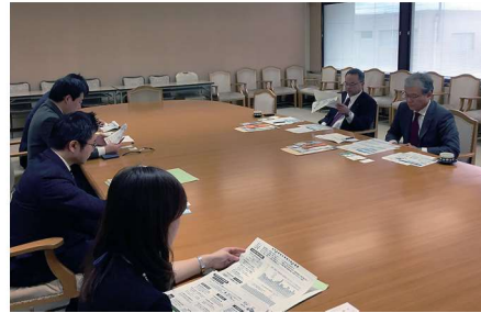
埼玉県庁で「公共施設アセットマネジメントの取り組み」について調査