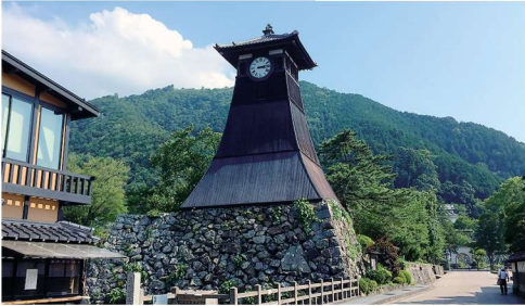
三の丸大手門の櫓台に建設された「辰鼓楼」