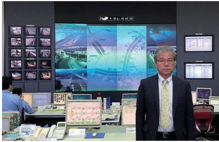
供用中の広島高速1号線から4号線の交通管制室

2016 4/19-20 (火) 中国道岡山米子線4車化促進鳥取議連での県外調査と要望活動