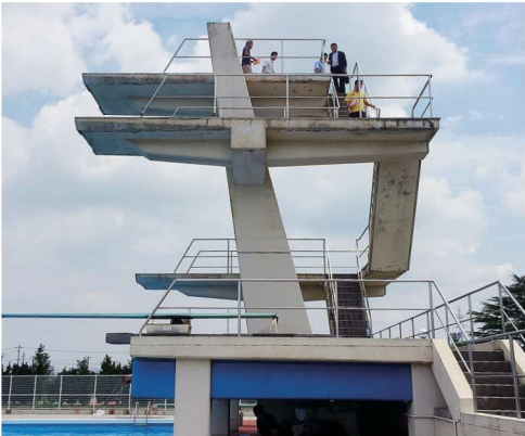
皆生温水プールと交換される事になった東山水泳場の飛び込み台