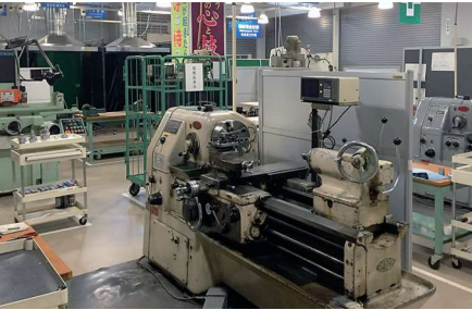
教材として活用されている引退した機械