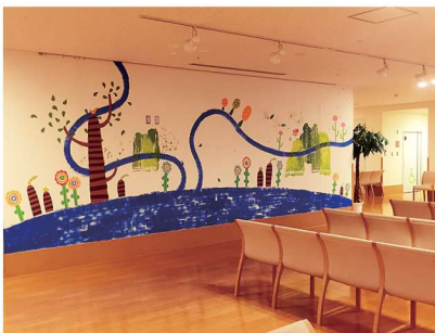
壁一面に色鮮やかに描かれたホスピタルアート