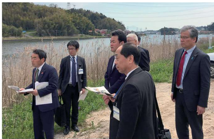
竹矢地区河川拡幅整備状況確認

2016 4/11-12 (月) 南部町朝綱ダム小水力発電施設・大橋川コミュニティセンター・島根原子力発電所視察