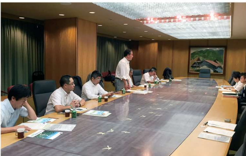
神奈川県庁にて殺処分ゼロに向けた取り組みについて説明を受ける