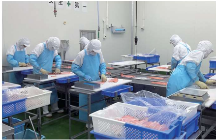
ラッピング前の最終チェック