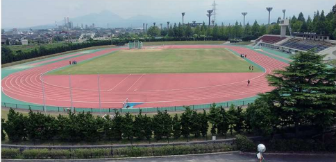
飛び込み台から眼下に見える陸上競技場