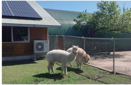
中国地方初の南米原産のアルパカ