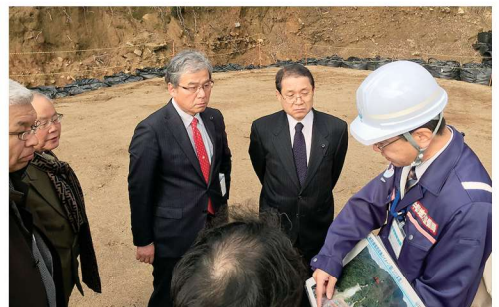
中国地方整備局 青戸副所長より災害の状況と復旧工事の進捗を聞く