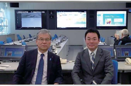
平成26年に運用を開始した「鳥取県災害情報システム」を視察

2016 4/19-20 (火) 中国道岡山米子線4車化促進鳥取議連での県外調査と要望活動