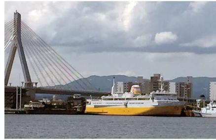
広報館として利用されている廃船となった青函連絡船