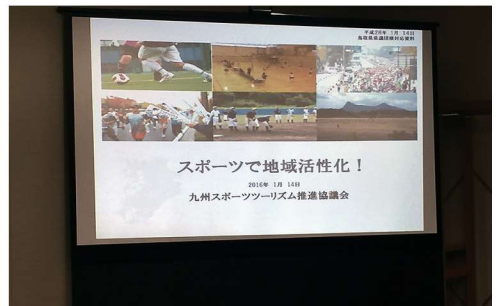
スポーツ合宿の誘致や受け入れ環境の構築について調査