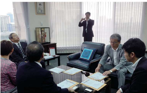
日本貿易機構 保住所長よりアセアン全体の経済状況について説明を受ける