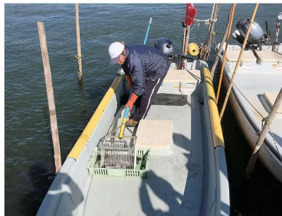
東郷湖にてシジミ漁を視察