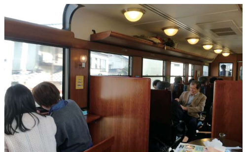
平均乗車率70%を誇るJR九州の看板列車「指定席のたまてばこ」